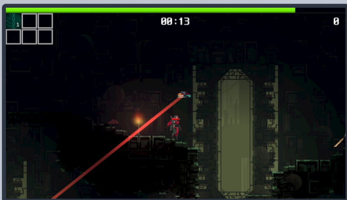
쉐이더를 이용한 광원처리 등을 통한 긍정적인 시각효과 제공

버튼을 눌러 사용하는 액티브 아이템으로 사용시 주변의 적들에게 유도하는 미사일을 발사합니다. 방향을 회전시킴으로써 적들을 쫓아가며, 적과 부딪힐시 넉백과 데미지를 줍니다.