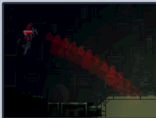
대시 등의 플레이어의 역동적인 움직임 제공